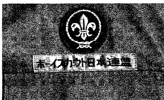
ボーイスカウト以上